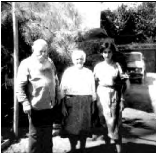
Молоканская семья из с. Лермонтово, Армения, август 1987 г.

В Фиолетово же преобладали прыгунские 1 семьи. Запомнился разговор в семье молодой женщины, у которой на тот момент уже было 7 человек детей. Из разговора с ней я