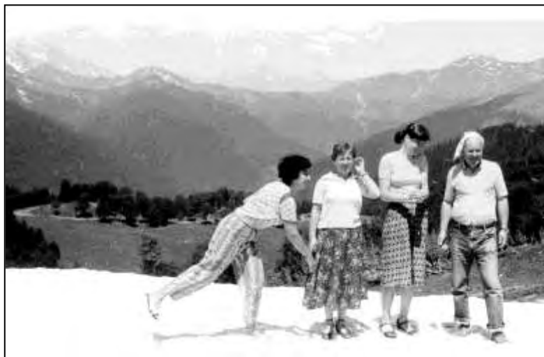
Высокогорный перевал по дороге к с. Псху. Абхазия, 1988 г.

В Псху мы жили в очаровательном гостевом домике, стоявшем у подножия зеленого холма. Когда утром я выходила из него, первое, что поражало воображение - обилие цветов, кустарников, деревьев и чудесный аромат всего этого цветущего и благоухающего великолепия, который буквально обволакивал тебя волшебным облаком, подхватывал и нес куда-то в райские кущи. Конечно, жить в таких условиях, в каких живут люди в Псху, по полгода оторванные от большой земли, с одной стороны очень сложно. Но когда хоть немного соприкасаешься с этой чарующей природой, которой мы, жители больших городов, лишены начисто, понимаешь, что она-то и дает этим замечательным людям силы выживать с достоинством даже в таких непростых условиях.