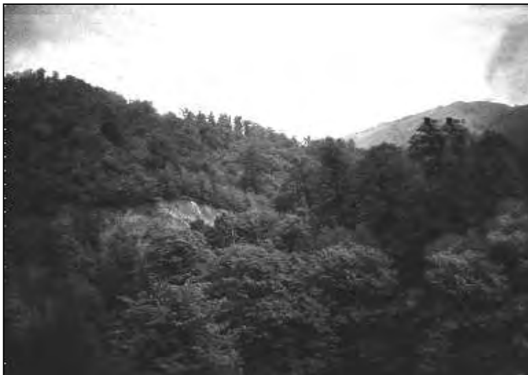
Талышские горы

ловленном месте, под большим валуном, свои пожертвования, на которые и живут люди, ухаживающие за рощей. Интересно, что деньги эти никогда не пропадают, хотя все знают, где они лежат.