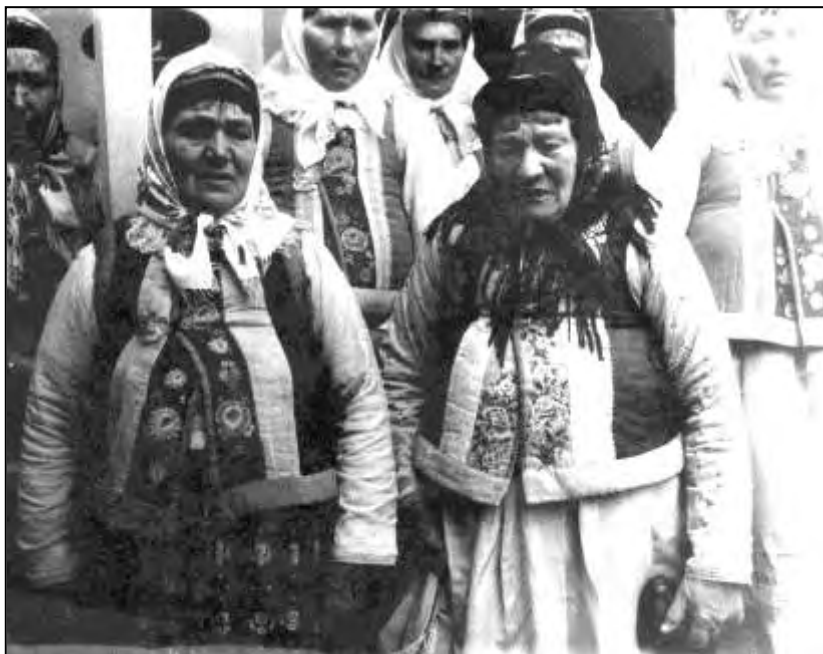
Духоборы на веранде сиротского дома после службы. с. Гореловка, Грузия, июнь 1988 г.