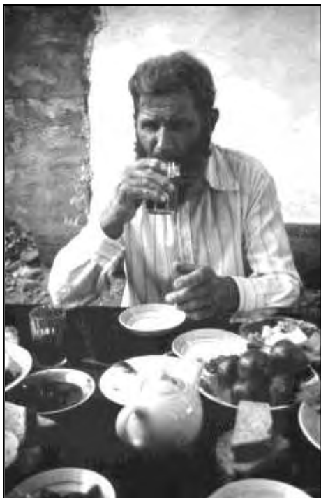
Завтрак. Молоканское с. Новоголовка, август, 1986 г.

И вот, наконец, наш верный ГАЗ-66 въезжает на пыльные улочки села Новоголовка. Это достаточно большое поселение раньше почти целиком населяли последо-