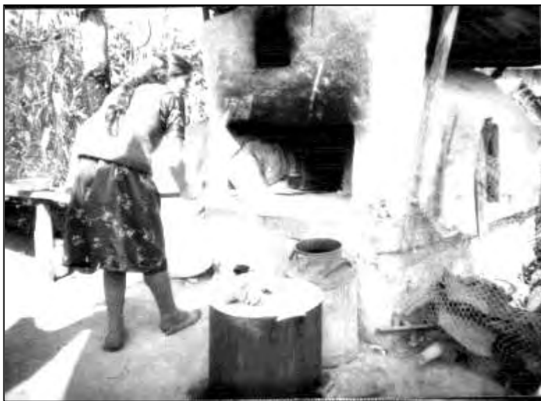
Азербайджанцы переняли у русских способ выпечки хлеба в русской печи. с. Ивановка, август 1987 г.

Нас пригласили на свадьбу, которая, как это практиковалось в годы лигачевско-горбачевской всеобщей борьбы со спиртным, была безалкогольной. Нам показали убранство комнаты для новобрачных, которая вся была увешана белоснежными крахмаленными вышитыми полотенцами. Из гостей на свадьбе присутствовали также армяне из соседних сел, с которыми у жителей Ивановки издревле были кунацкие отношения.