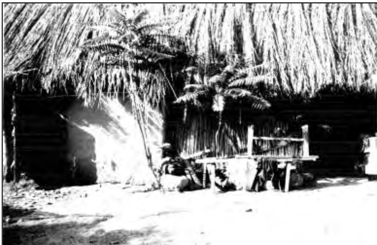
Это – совсем даже не Новая Гвинея! Это – с. Новоголовка, август 1986 г.