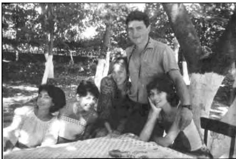
Редкие минуты отдыха. Во дворе гостиницы в с. Ивановка, август 1987 г.