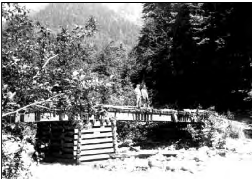
Сломанный мост на дороге к с. Псху. Абхазия, 1988 г.

гой. Но в тесноте, да не в обиде! По пути мы пели песни, шутили и дорога не показалась нам тяжелой.