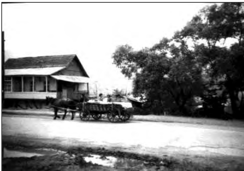
Молоканское с. Лермонтово. Армения, август 1987 г.

поняла, что для прыгунов это отнюдь не предел (в селе были семьи с 16 и более детьми). И хотя эта семья была не из зажиточных, все дети были хорошо ухожены и, что, пожалуй, самое главное – здоровы.