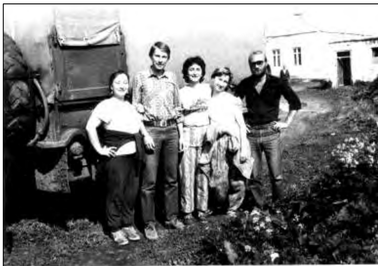
На маленький экспедиционный отряд на фоне верного ГАЗ-66 и сельской школы, где мы жили. Духоборье. Высокогорное с. Тамбовка. Грузия, июнь 1988 г.