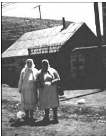
Две бабушки-молоканки на улице с. Новоивановка, 1987 г.

Наш пестрый табор довольно быстро оправился от первого потрясения, вскоре уже слышались шутки-прибаутки, кто-то достал нехитрую провизию, и, поделившись с другими, принялся трапезничать, кто-то вовсю резался в карты. Природные жизнелюбие и оптимизм армянского народа и тут пришли ему на выручку. Да и что сказать, бегая по аэропорту в попытках добиться хоть какого-то вра-